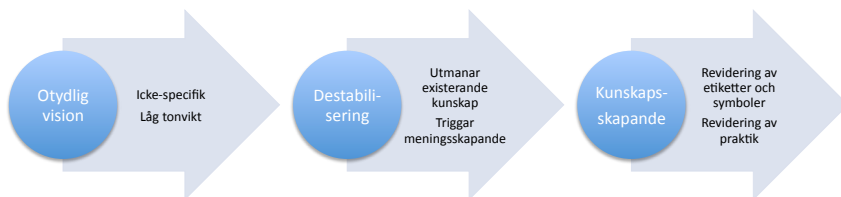
Figur 3. Strategiprocessen i tre steg. Från Gioia med flera (2012), fri översättning från engelska.

Vad som däremot är av högsta vikt är nästa steg, att denna otydlighet blir definierad och konkretiserad. Forskare har också upptäckt att förändring enklare genomförs om den också är kopplad till en symbolik (se också Collins och Porras, 1994/2011) och om denna symbolik är otydlig kan organisationens medlemmar tolka den på det vis som bäst passar dem. Gioia med flera (2012) sammanfattar processen i tre steg;