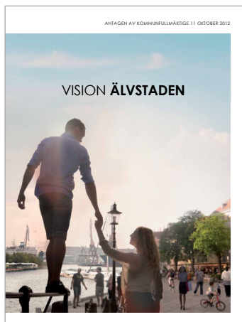
Bild 2. Dokumentet i sin färdiga form.

visionen formulerades tre strategier; ” hela staden, möta vattnet ” och stärka kärnan ”. Med hela staden avses att skapa en stad för alla, bygga samman staden och att få fler delaktiga. Möta vattnet kan sammanfattas i att skapa ett levande älvrum, göra det lätt att leva hållbart samt att se klimatanpassningen som en drivkraft. Att stärka kärnan innebär att frigöra drivkrafterna, låta kärnan komma närmare och att skapa en attraktiv stadsmiljö. I dokumentet finns också en modell för stadsutveckling som betonar att visionen är navet och att arbetet med stadsutveckling kretsar kring; ledarskap, samarbete, delaktighet, lärande och helhetssyn (Vision Älvstaden, 2012). Efter att dokumentet antagits fortsätter arbetet med att förverkliga det som står formulerat och det har av den anledningen tagits fram en etappindelning för de olika områdena inom Älvstaden. Vid tiden för de sista intervjuerna som genomfördes inom ramen för forskningsprojektet var det inte beslutat angående hur detta skulle ske och organiseras och utgjorde en fråga som diskuterades intensivt. Vad som händer i projektet går att följa på webportalen; http://alvstaden.goteborg.se/