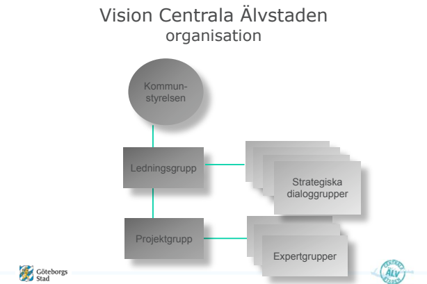
Figur 1. Organisation av Älvstadsprojektet.

Uppdraget att formulera vision och strategier för Älvstaden gavs till en projektorganisation bestående av en projektgrupp med en ledningsgrupp som placerades direkt under kommunstyrelsen. Organisatoriskt såg det ut på följande sätt;